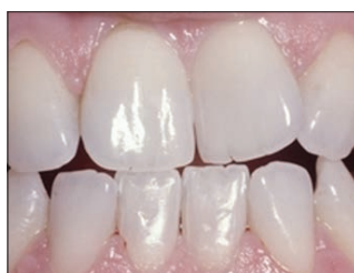
Спустя восемь дней отбеливания с помощью Opalescence PF 15%, каждый день по 3 часа.