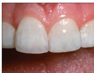
Спустя шесть дней отбеливания с помощью Opalescence PF 10%, каждая ночь по 8 часов. Новые композитные пломбы установлены.