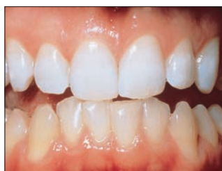
Верхние зубы после пяти ночей отбеливания, около 40 часов.