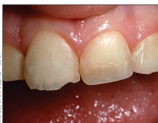
До отбеливания; запланировано лечение.