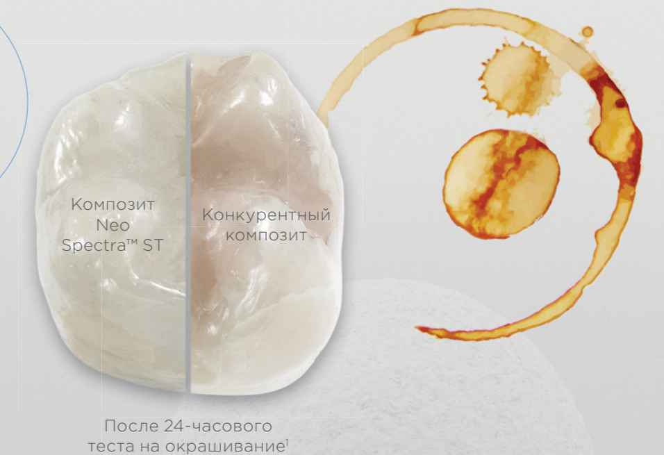
После 24-часового теста на окрашивание 1

80% пациентов видят различия между зубами с пломбами и без них 4