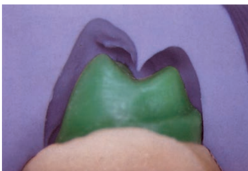
Контрольная матрица для создания металлической структуры