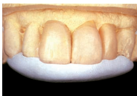
Матрицы для изготовления временных протезов