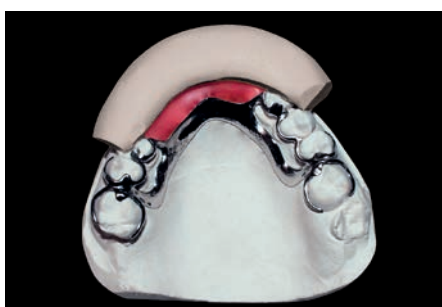
Контрольная матрица для проектирования металлической структуры