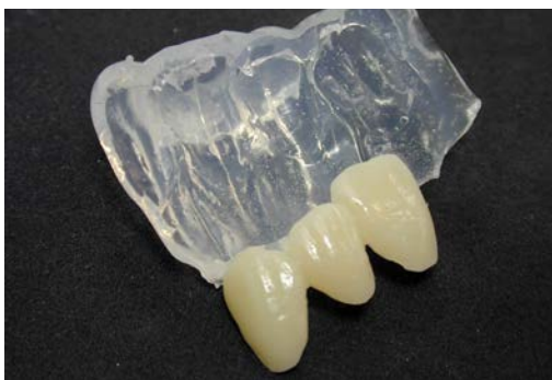
Идеальная твёрдость для применения композита без создания деформации