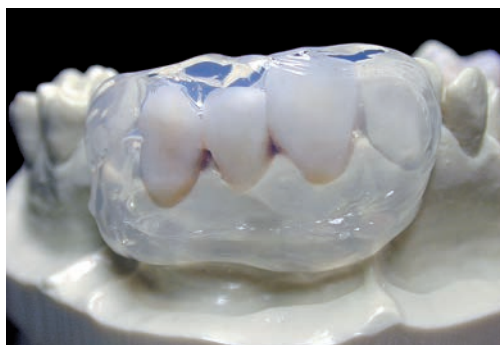
Высокая степень прозрачности