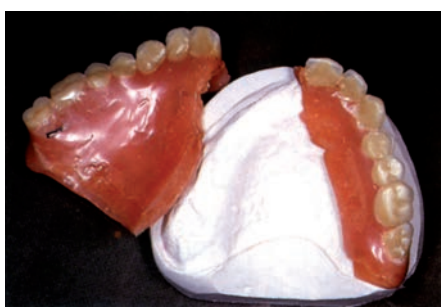
Починка съёмных протезов