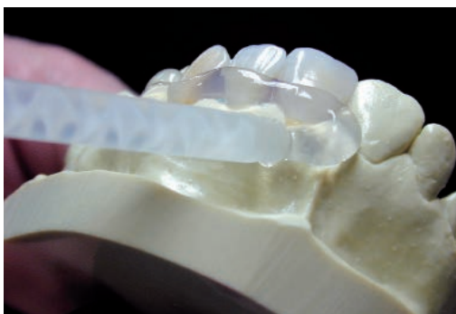
Высокая текучесть ELITE TRANSPARENT при нанесении