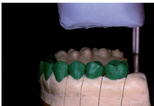
Работа с керамикой на вертикуляторе