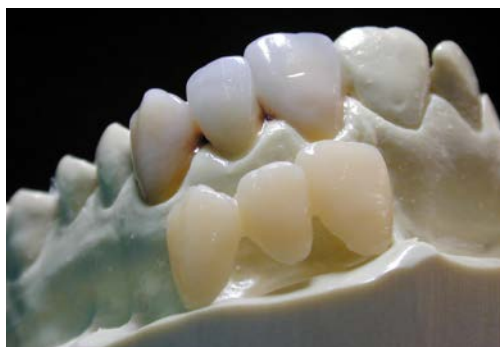
Конечный результат: компактная поверхность конечного продукта из композита в сравнении с традиционными работами из светотверждаемых пластмасс