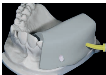
Матрица из ZETALABOR с каналами для инъектирования